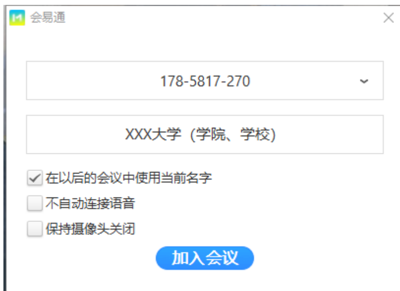
图 2 ( 示例 )