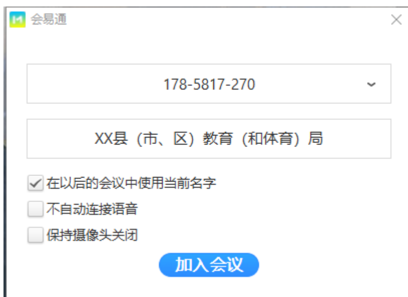
图 1 ( 示例 )