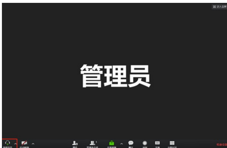
图 3 ( 示例 )